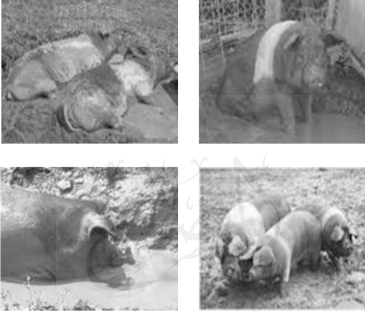
شكل (٤) يبين حب الخنازير للطين والوحل لترطيب جسدها

تفتقر الخنازير إلى الغدد العرقية التي تعمل على خفض حرارة بقية الثدييات ولذلك فهي تحتاج للمياه أو للطين لتبريد أجسامها (شكل ٤) في درجات الحرارة المرتفعة.