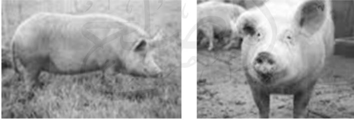
شكل (١) الشكل الخارجي للخنزير: حيوان كرية المنظر

الخنزير حيوان كرية المنظر ضخمة الجثة كتلي الشكل مكنتز اللحم قصير الأرجل له جلد سميك عليه شعر خشن وله بوز طويل وأنياب قوية (شكل ١) تم استثناسه منذ حوالي ١١٠٠٠ سنة مضت ويعرف منه اليوم أكثر من أربعمئة سلالة.