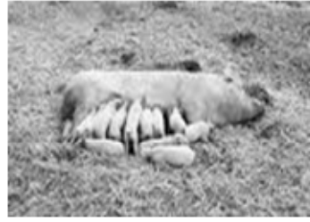
شكل (٢) يبين كثرة عدد الحملات (٨ على كل جانب) وكثرة عدد الخنوص للخنزيرة

ويموت عدد من الخنوص نتيجة الهرس بالأرجل لكثرة عدد الخنوص في الفرشة أو لعدم حصوله على اللبن من الأم. ويبلغ ذكر الخنزير بعد ٨ - ١٠ أشهر من الولادة. وسوف نحتاج إلى هذه الأرقام عند المقارنة بين الأنعام الحلال والخنزير الحرام (١) (٢). وتتعدد ألوانه وتتراوح بين الأبيض، والوردي، والبني، والأسود، كما قد يكون مزيجاً من تلك الألوان. (شكل ٣).