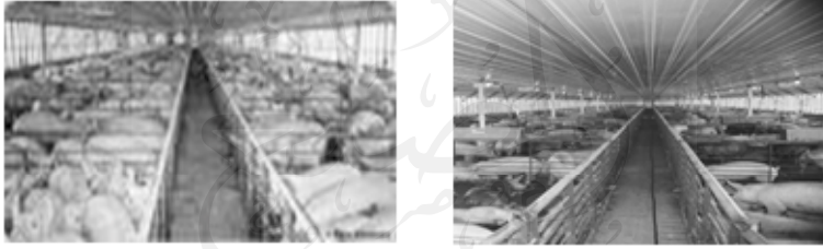
شكل (٥) يبين حظائر الخنازير في المجتمع الغربي وتغذيتها على الأعلاف

يمنع إن تغذت الخنازير على القاذورات أو الأعلاف أن تكون محرمة في كلا الحالتين؛ لأن العلة كما بينها ربنا عز وجل في تركيب وضرر لحم الخنزير حتى وإن أكل الأعلاف الجيدة، فهو بطبعه الخبيث يأكل روثه الذي اختلط ببوله وبهذا يتراكم في لحم كميات هائلة من حمض البولييك المخرج مع بوله وروثه ولئن لم يجد ما يأكله يأكل صغاره. وحيث إن الحكم الشرعي قائم إلى أن تقوم الساعة فما علينا إلا التصديق بكتاب ربنا وسنة نبينا محمد ﷺ والانصياع للحكم الشرعي، وإلا كنا مكذبين لكتاب ربنا عز وجل. ولا يتأتى لمسلم أن يفعل ذلك ونعوذ بالله من الخذلان. وسوف أبين نجاسة لحم الخنزير عند الكلام على أن العلة في تحريم لحم الخنزير ذاتية، وليست مكتسبة وبيان التركيب الكيميائي للحم الخنزير وفي بحثنا هذا غنية وكفاية بإذن الله تعالى: .