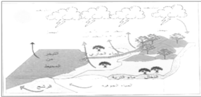
(شكل ٤) دورة الماء في الطبيعة

ومن ذلك تتضح أهمية هذه الصورة من الماء حيث تظهر قدرة الحق تبارك وتعالى في جعل تلك الصورة من الماء متاحة للنبات ، وإن تكونت من مياه البحار المالحة، ويظهر ذلك من خلال دورة الماء في الطبيعة .