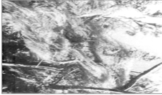
(شكل ٣) أشنة تنمو على نبات العرعر

مثال على ذلك الأشنات المعلقة التي تنمو على أشجار العرعر في مرتفعات عسير جنوب المملكة العربية السعودية ، وهي تستطيع امتصاص بخار الماء من الجو المشبع دون أن يتكثف .